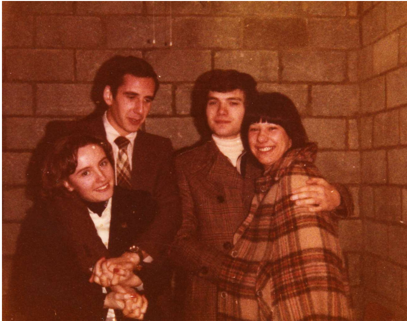
Certains se sont connus au Cta !!!!