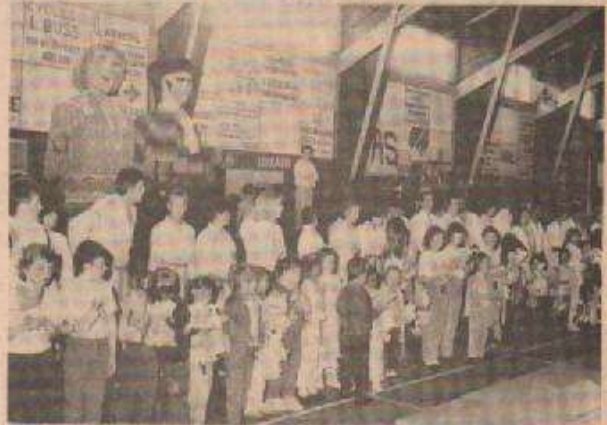
Une vue de la présentation des groupes sportifs.

Bref, une opération totalement réussie à Arlon et dans la province, à laquelle il faut encore mentionner le concours logistique apporté par les membres du Rotary Club.