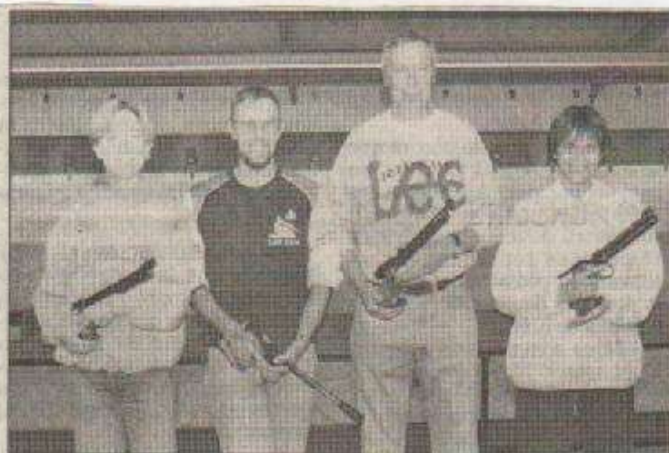
Beau tir groupé pour le CTA qui compte quatre champions de Belgique.