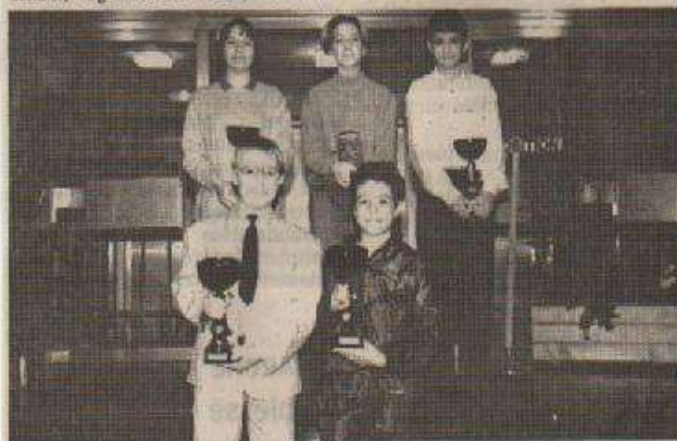
Les espoirs du tir sportif provincial.