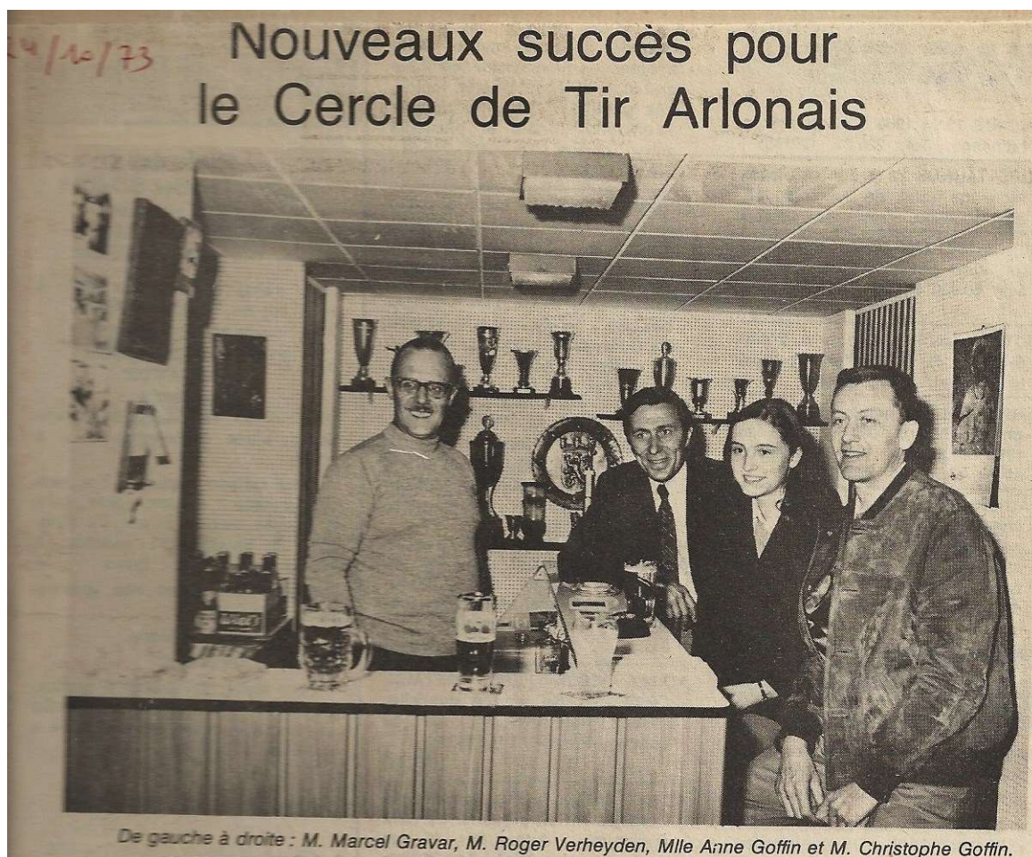
Photo de la buvette de la rue du musée avec des anciennes gloires du CTA Octobre 1973