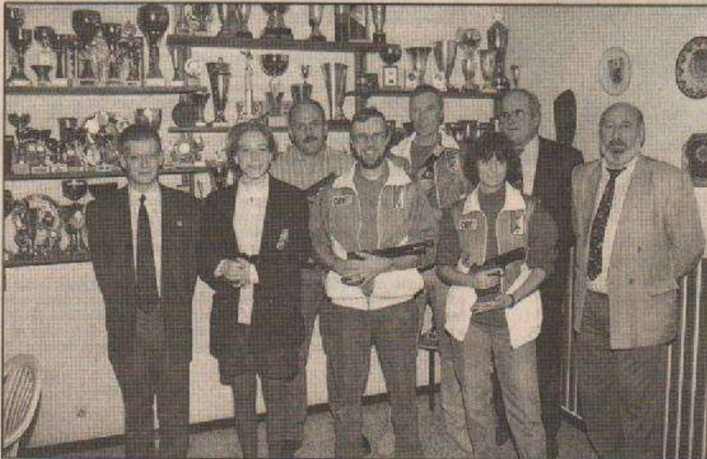
Les quatre champions et vice-champions du tir arlonais.