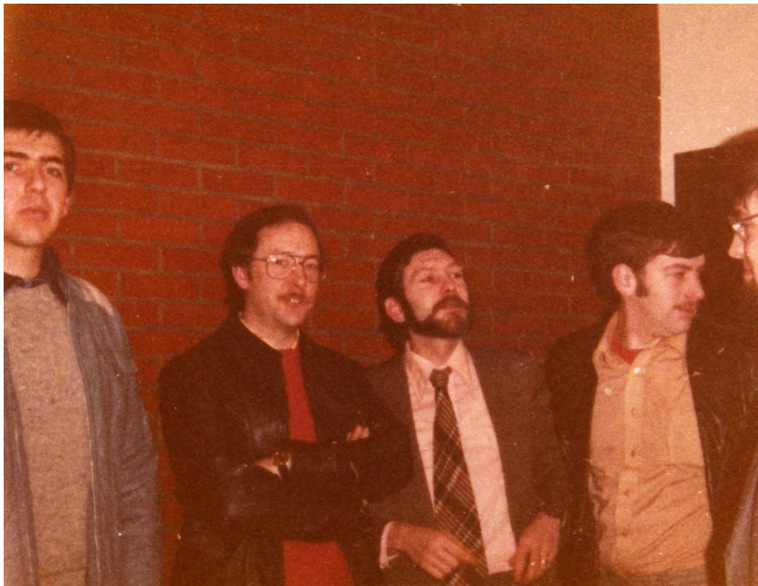
Pendant ce temps-là, d'autres prenaient la pause!!!!!!